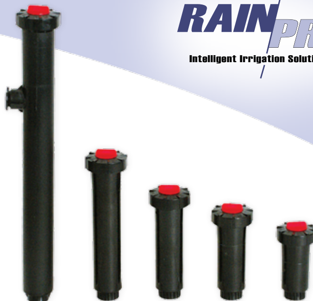
712F 706F 704F 703F 702F